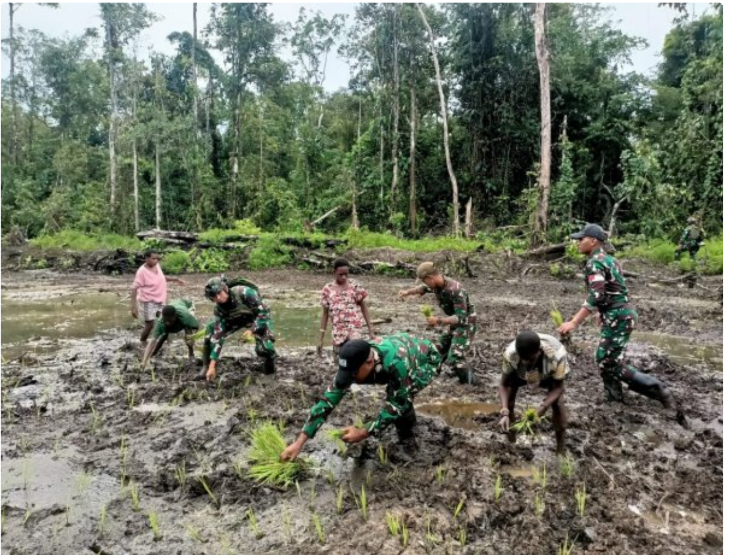
Foto: Satgas Pamtas Mobile RI-PNG Yonif 503/Mayangkara mengagas program ketahanan pangan yang